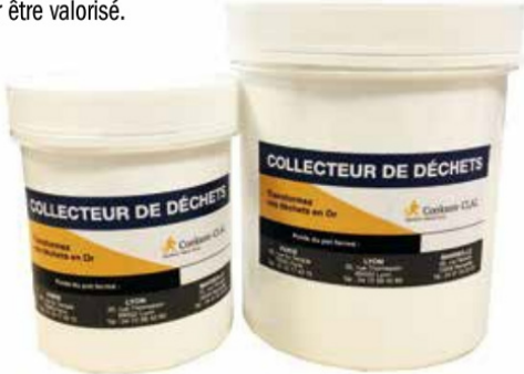
Pots collecteur de déchets

Dès que le pot est plein, il peut être envoyé ou apporté en agence pour être valorisé.