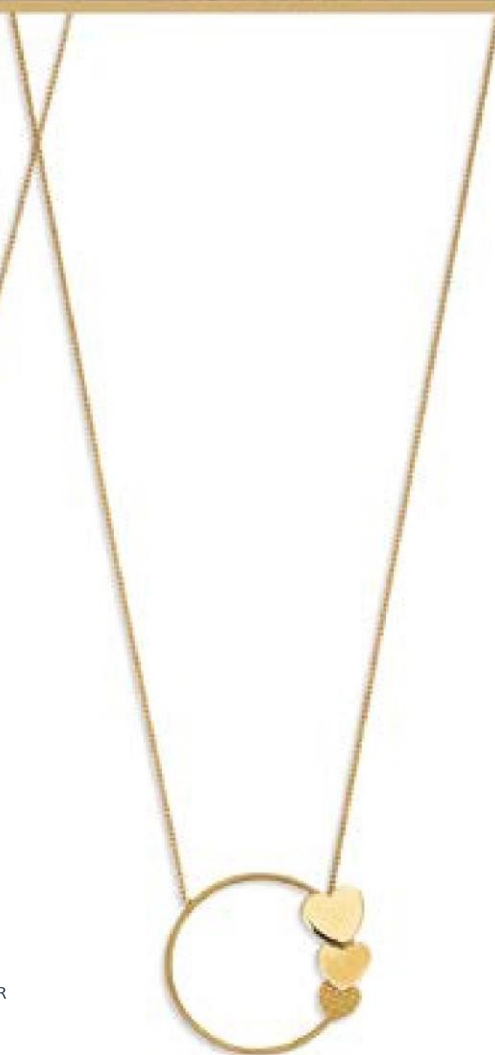
VLFR9230 - 42 CM - 2,80 G - AR 14G90 - 118P86