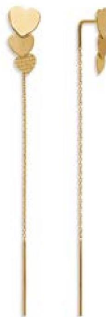
XLFR8925 - H 7 CM - 2,00 G 14G90 - 84Pr90