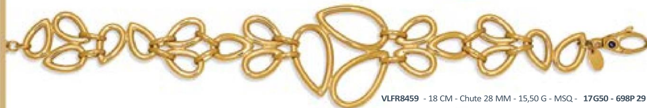
VLFR8459 - 18 CM - Chute 28 MM - 15,50 G - MSQ - 17G50 - 698P 29