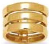
XLFR609* - 8,00 G 18G44 - 367P93