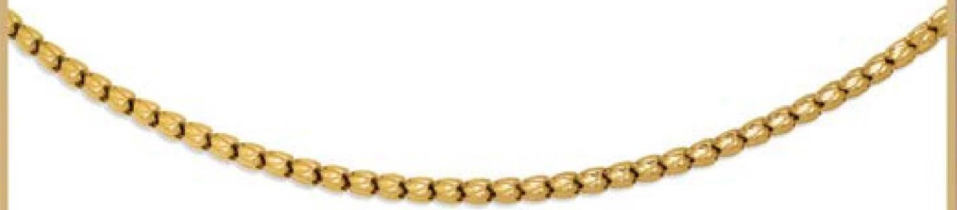
VLFR9233 - 43 CM - 5 MM - 28,60 G - CLQ 19G00 - 1331P36