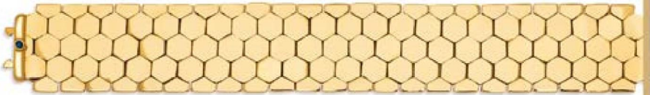
VLFR9260 - 17,5 CM - 24 MM - 55,00 G - FP -13G00 - 2230P32