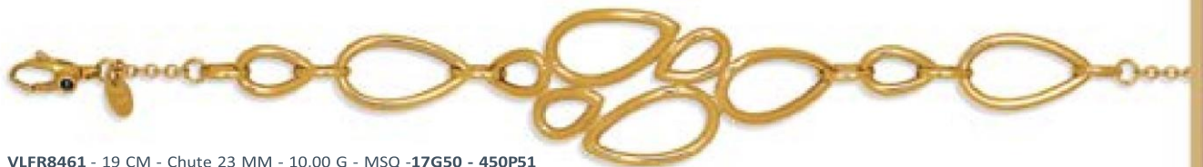
VLFR8461 - 19 CM - Chute 23 MM - 10,00 G - MSQ - 17G50 - 450P51