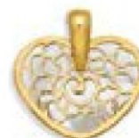
XLFR9043 H 1,5 CM - 0,43 G 22P00 - 33P85 Nacre