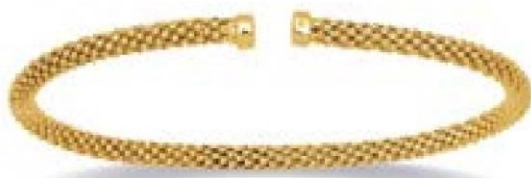
VLFR9147 - Ø 58X45 MM - 3,3 MM - 7,30 G 8G14 - 260P55