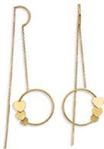
XLFR8926 - H 5 CM - 2,50 G 14G90 - 106Pr13