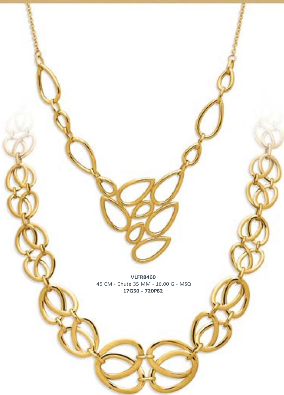
VLFR8460 45 CM - Chute 35 MM - 16,00 G - MSQ 17G50 - 720P82