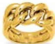
XLFR611* - 11,00 G 179P00 - 482P06