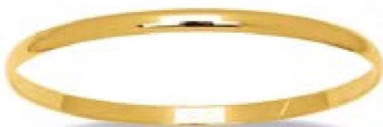
VLFR9236 - Ø 60 MM - 4 MM - 13,00 G - 7G90 - 460P87 VLFR9237 - Ø 63 MM - 4 MM - 13,60 G - 7G90 - 482P14 VLFR9238 - Ø 65 MM - 4 MM - 14,00 G - 7G90 - 496P32