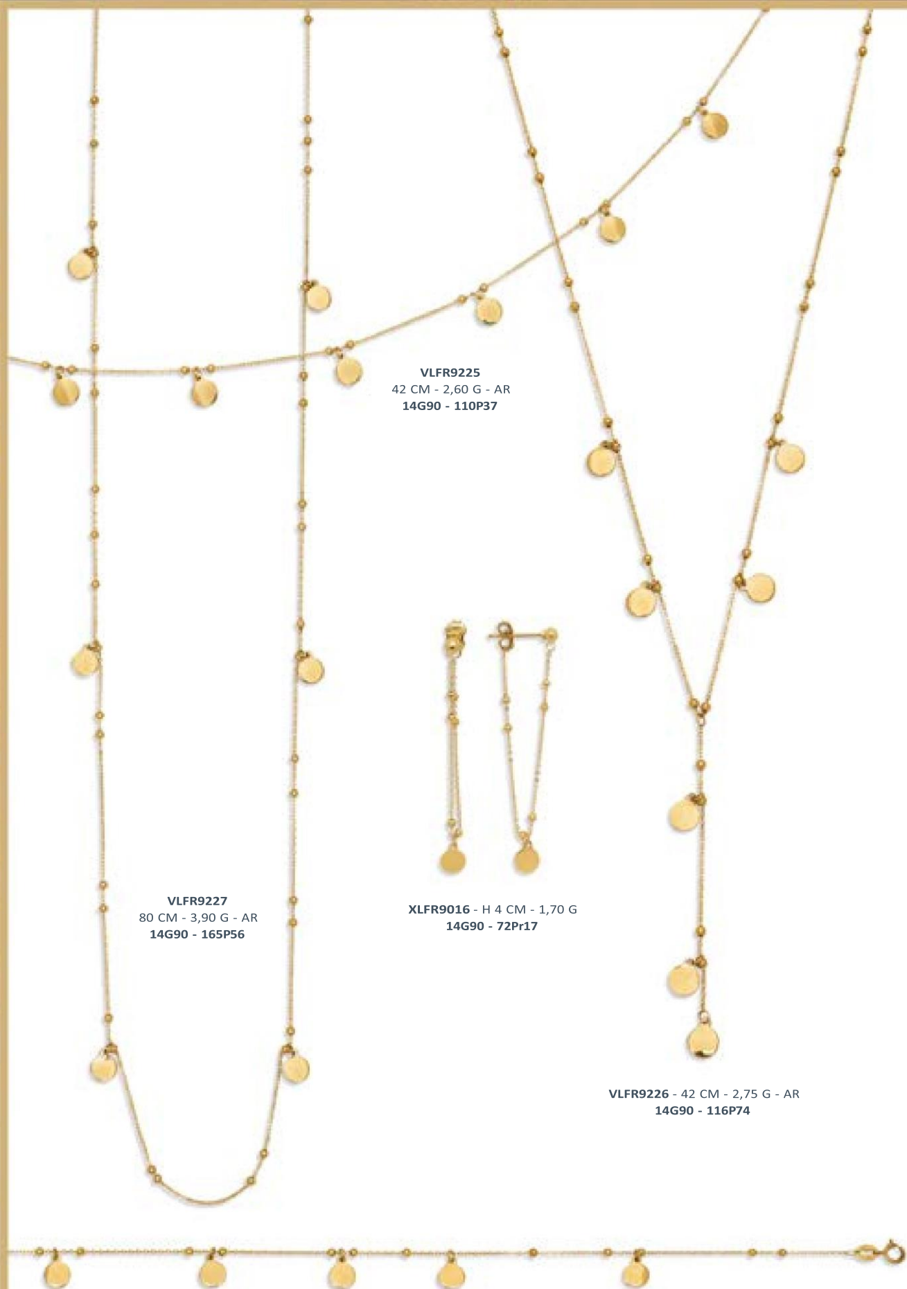
VLFR9225 42 CM - 2,60 G - AR 14G90 - 110P37