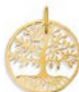
XLFR9046 Ø 18 MM - 0,80 G 39P00 - 61P04