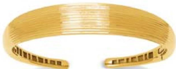
VLFR9217 - Ø 61X48 MM - 12 MM - 27,00 G 18G44 - 1241P76