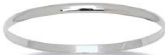
VMFR9236 - Ø 60 MM - 4 MM - 13,00 G - 8G20 - 464P77 VMFR9237 - Ø 63 MM - 4 MM - 13,60 G - 8G20 - 486P22 VMFR9238 - Ø 65 MM - 4 MM - 14,00 G - 8G20 - 500P52