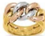
XNFR611* - 11,00 G 179P00 - 482P06