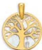
XLFR9044 Ø 18 MM - 0,65 G 33P00 - 50P91 Nacre