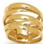
XLFR610* - 8,00 G 18G44 - 367P93