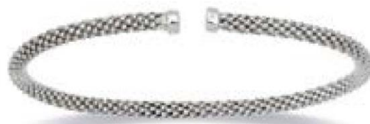
VMFR9147 - Ø 58X45 MM - 3,3 MM - 7,30 G 9G37 - 269P52