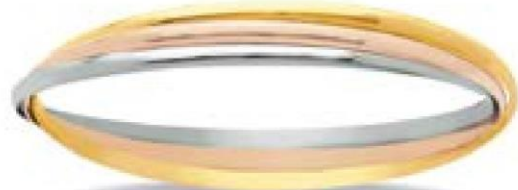
VNFR0524 - Ø 65 MM - 2,5 MM - 18,00 G - 10G51 - 685P10 VNFR8448 - Ø 65 MM - 3 MM - 25,00 G - 10G51 - 951P53