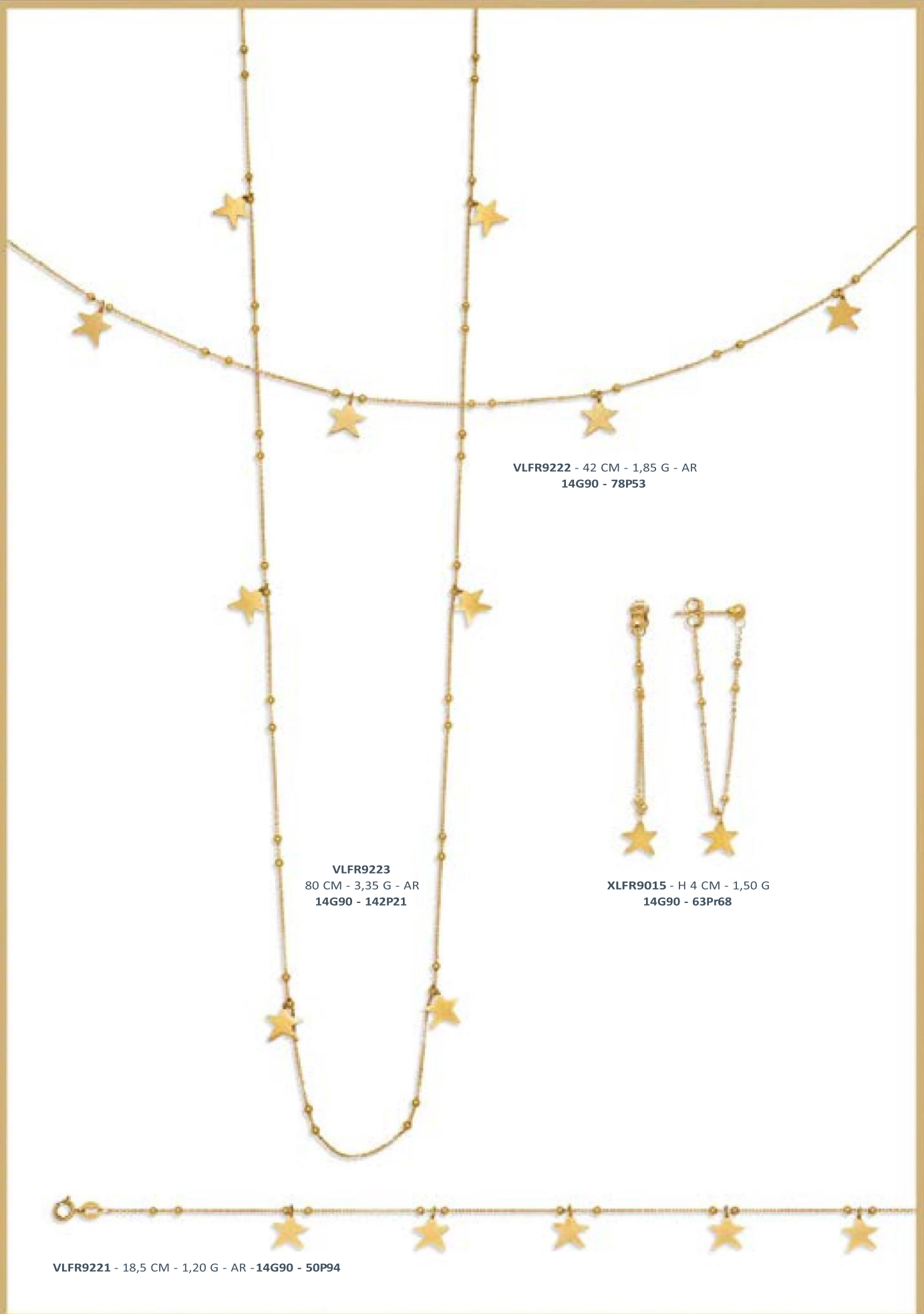
VLFR9222 - 42 CM - 1,85 G - AR 14G90 - 78P53