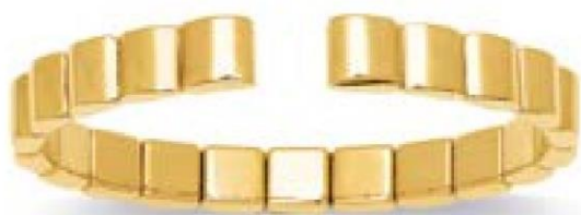
VLFR8454 - Ø 60X48 - 7 MM - 13,00 G 12G90 - 525P87