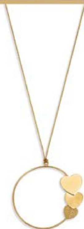
VLFR9228 - 72 CM - 3,40 G - AR 14G90 - 144P33