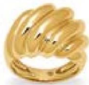
XLFR612* - 10,00 G 150P00 - 425P51