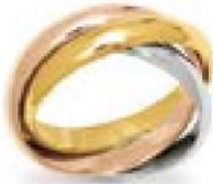
XNFR614* - 11,00 G 170P00 - 473P06