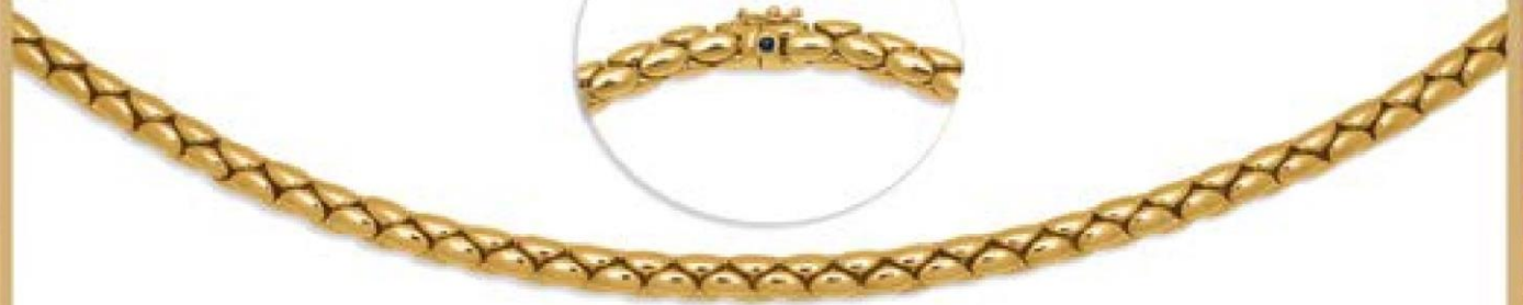
VLFR9235 - 46 CM - 6 MM - 52,00 G - CLQ 19G00 - 2420P66