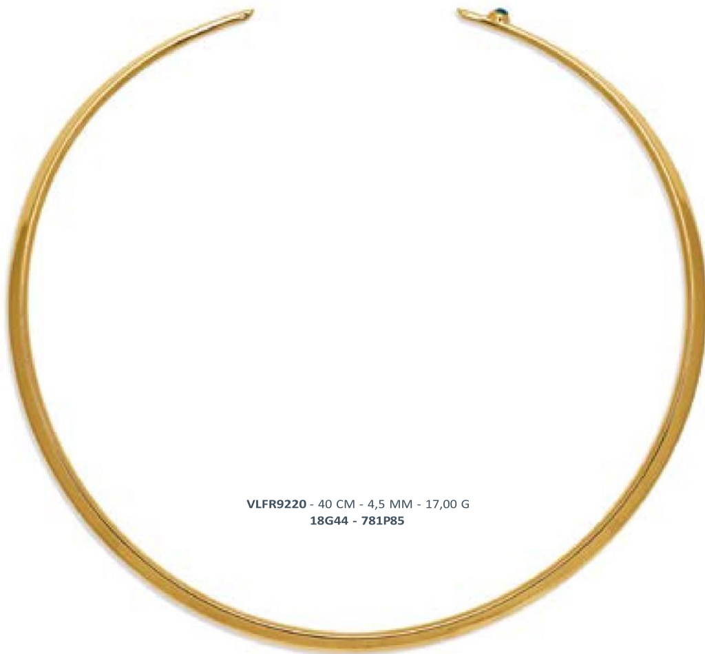
VLFR9220 - 40 CM - 4,5 MM - 17,00 G 18G44 - 781P85