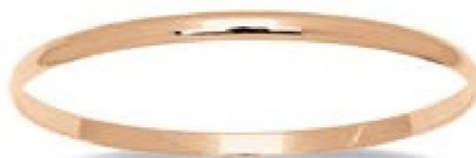
VOFR9236 - Ø 60 MM - 4 MM - 13,00 G - 7G90 - 460P88 VOFR9237 - Ø 63 MM - 4 MM - 13,60 G - 7G90 - 482P14 VOFR9238 - Ø 65 MM - 4 MM - 14,00 G - 7G90 - 496P32