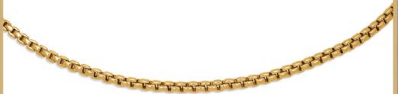
VLFR9257 - 45 CM - 5 MM - 30,00 G - MSQ 10G00 - 1126P54