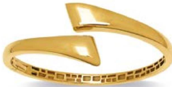
VLFR9216 - Ø 61X48 - 5/18 MM - 22,00 G 18G44 - 1011P81