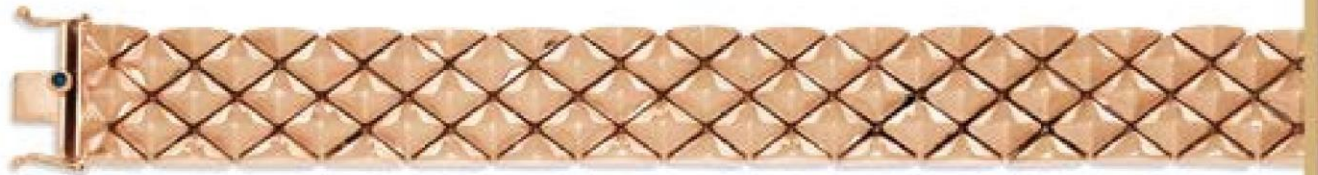
VOFR9261 - 18 CM - 17 MM - 52,00 G - CLQ -13G00 - 2108P66