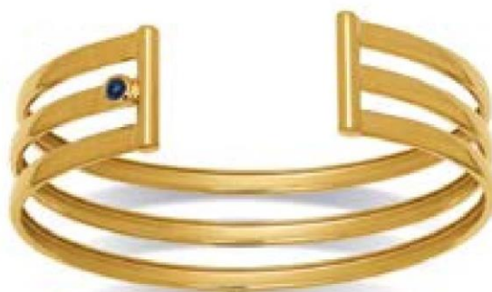
VLFR9218 - Ø 61X48 MM - 16 MM - 19,00 G 18G44 - 873P83