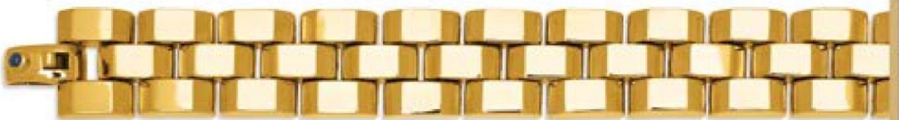
VLFR9263 - 18 CM - 20 MM - 62,00 G - FI -13G00 - 2514P17