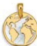
XLFR9042 Ø 15 MM - 0,45 G 30P00 - 42P40 Nacre