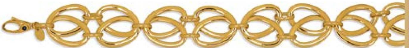
VLFR8457 - 19 CM - 18 MM - 18,00 G - MSQ - 17G50 - 810P92