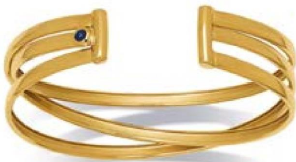
VLFR9219 - Ø 61X48 MM - 18 MM - 19,00 G 18G44 - 873P83