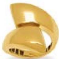
XLFR607* - 9,00 G 18G44 - 413P92