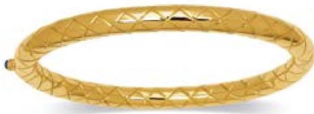
VLFR9258 - Ø 60X50 MM - 6 MM - 21,00 G - CLQ 13G00 - 851P58