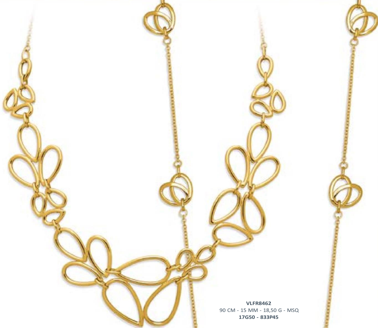
VLFR8462 90 CM - 15 MM - 18,50 G - MSQ 17G50 - 833P45