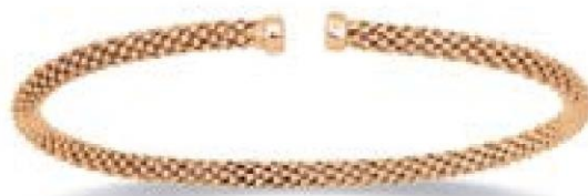
VOFR9147 - Ø 58X45 MM - 3,3 MM - 7,30 G 8G14 - 260P55