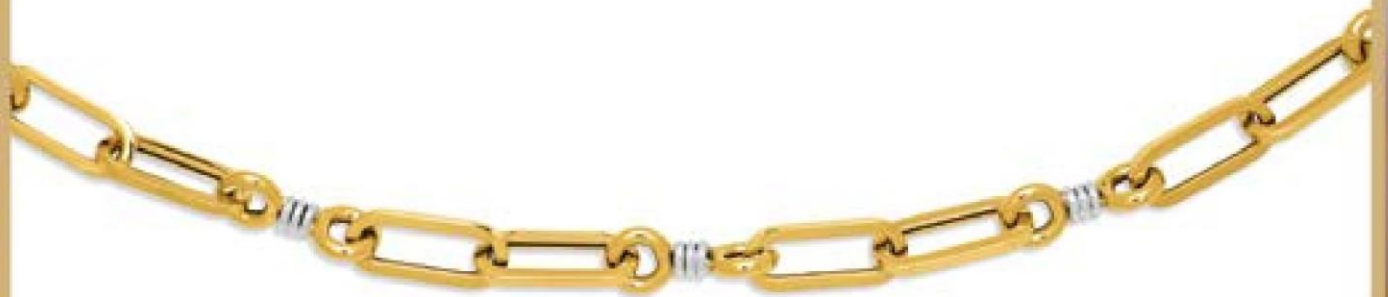
VNFR9247 - 50 CM - 8 MM - 27,00 G - MSQ 14G50 - 1135P38