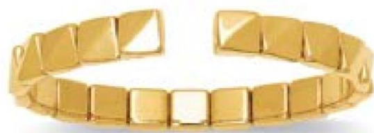
VLFR8455 - Ø 60X48 - 7 MM - 13,00 G 12G90 - 525P87