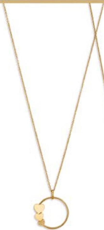
VLFR9229 - 42 CM - 2,40 G - AR 14G90 - 101P88