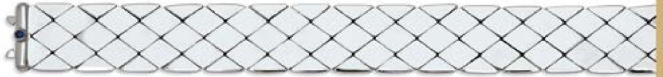
VMFR9259 - 17,5 CM - 18 MM - 47,50 G - FP -13G00 - 1926P18