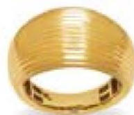
XLFR608* - 9,50 G 18G44 - 436P92