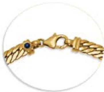
VLFR9244 - 42 CM - 6,5 MM - 17,00 G - MSQ - 11G50 - 663P87 VLFR9245 - 45 CM - 6,5 MM - 18,00 G - MSQ - 11G50 - 702P92