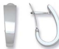
XMFR3584 - H. 18 MM - 3,20 G 111Pr18 - 199Pr25