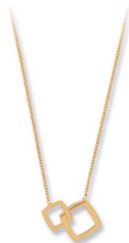
VLFR8432 - 42 CM - 2,08 G - AR 12G50 - 83P24