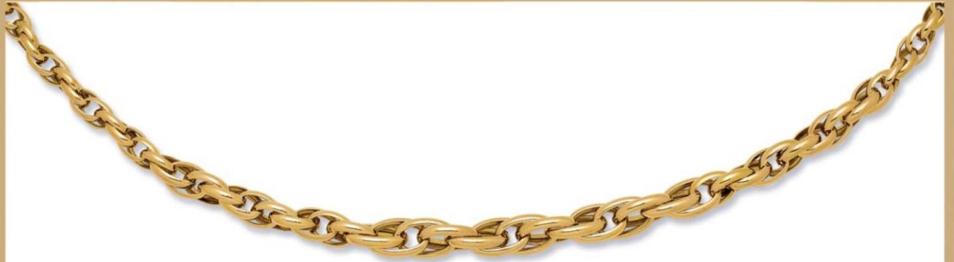
VLFR8269 - 45 CM - Chute 8 MM - 20,00 G - MSQ - 9G03 - 731P02