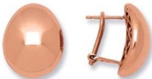
XOFR4060 - H. 18 MM - 5,60 G 13G16 - 227Pr81