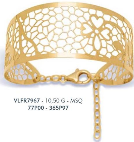
VLFR7967 - 10,50 G - MSQ 77P00 - 365P97