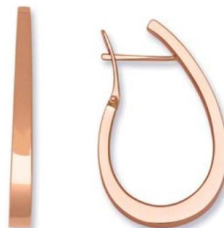
XOFR4061 - H. 37 MM - 6,10 G 179Pr00 - 346Pr88