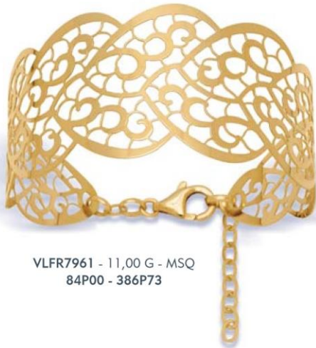
VLFR7961 - 11,00 G - MSQ 84P00 - 386P73