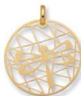
XLFR3589 - Ø 20 MM - 0,65 G 11P50 - 29P39