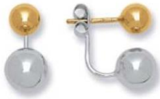
XNFR8437 - Ø 6/8 MM - 2,50 G 119Pr00 - 187Pr80