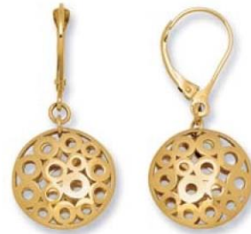
XLFR3594 - 4,40 G 10G10 - 165Pr53