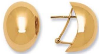
XLFR8842 - H. 20 MM - 8,80 G 159Pr00 - 432Pr19