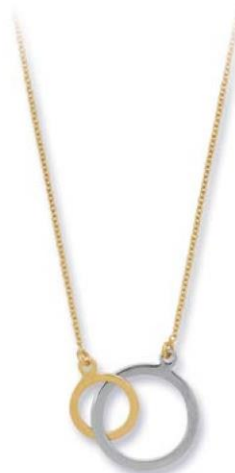
VNFR8433 - 42 CM - 2,20 G - AR 13G00 - 89P15