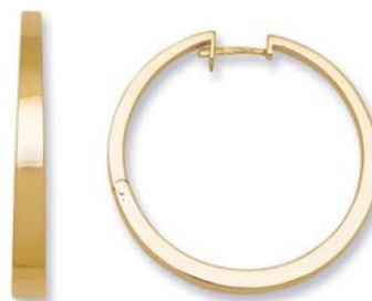
XLFR3586 - Ø 28 MM - 5,75 G 162Pr18 - 320Pr43