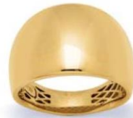
XLFR318* - 15 MM - 5,80 G 13G16 - 235P95