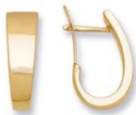
XLFR3587 - H. 18 MM - 3,20 G 100Pr98 - 189Pr05