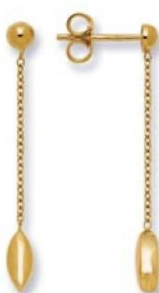
XLFR3596 - H. 35 MM - 1,60 G 26Pr00 - 70Pr03