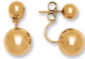
XLFR8448 - Ø 7/12 MM - 4,50 G 160Pr00 - 283Pr85