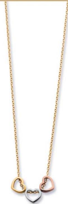
VNFR8016 - 45 CM - 4,10 G - MSQ 75P00 - 187P84