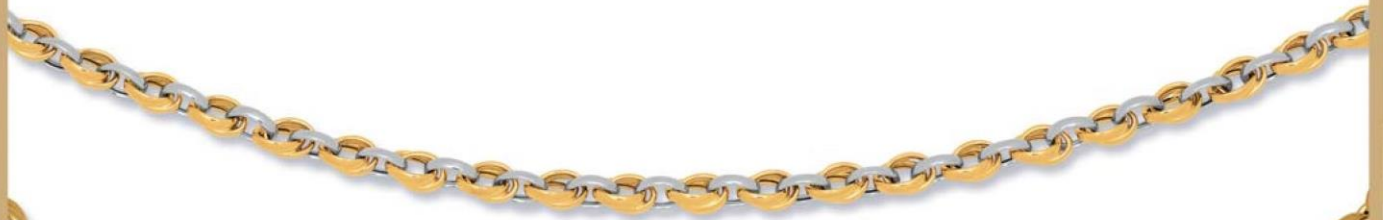
VNFR8018 - 45 CM - 19,50 G - MSQ - 11G50 - 760P91