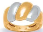
XNFR016* - 6,30 G 99P00 - 269P63