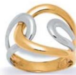
XNFR018* - 4,30 G 160P00 - 278P34