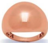
XOFR319* - 15 MM - 4,10 G 13G16 - 166P79