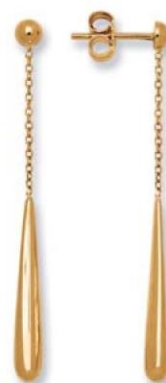
XLFR8435 - H. 50 MM - 2,40 G 37Pr00 - 103Pr05