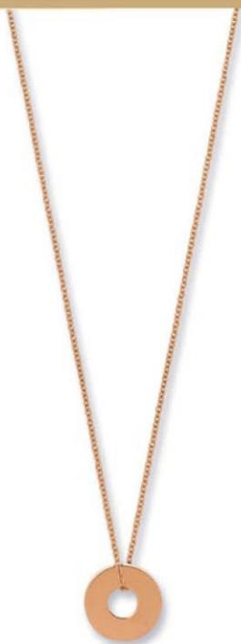
VOFR7982 - 42 CM - 1,95 G - AR 9G90 - 72P97