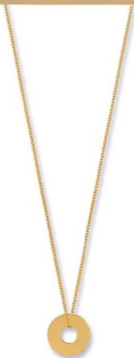
VLFR7982 - 42 CM - 1,95 G - AR 9G90 - 72P97