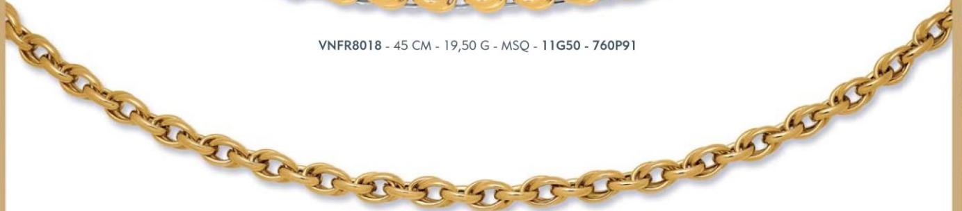
VLFR8271 - 45 CM - 24,00 G - MSQ - 9G03 - 877P23