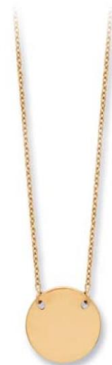
VLFR8428 - 17,5/19 CM - 3,40 G MSQ - 59P00 - 152P57