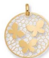
XLFR3599 - Ø 20 MM - 0,80 G 11P50 - 33P52