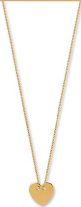
VLFR7981 - 42 CM - 1,95 G - AR 9G90 - 72P97