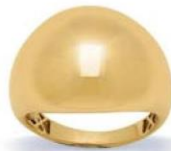
XLFR319* - 15 MM - 4,10 G 13G16 - 166P79