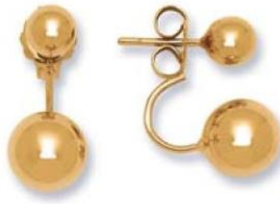
XLFR8447 - Ø 6/10 MM - 3,50 G 145Pr00 - 241Pr32