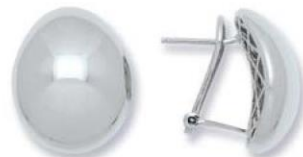
XMFR4060 - H. 18 MM - 5,70 G 13G16 - 231Pr88