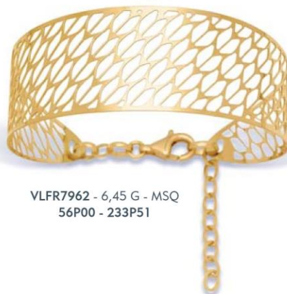
VLFR7962 - 6,45 G - MSQ 56P00 - 233P51