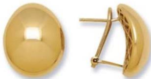
XLFR4060 - H. 18 MM - 5,70 G 13G16 - 231Pr88