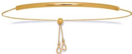
VLFR8442 - 2,5 MM - 1,45 G - Réglable 11G90 - 57P16