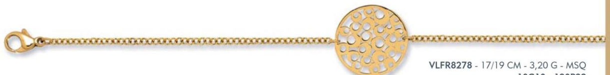
VLFR8278 - 17/19 CM - 3,20 G - MSQ 10G10 - 120P39