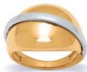
XNFR019* - 6,00 G 190P00 - 355P13