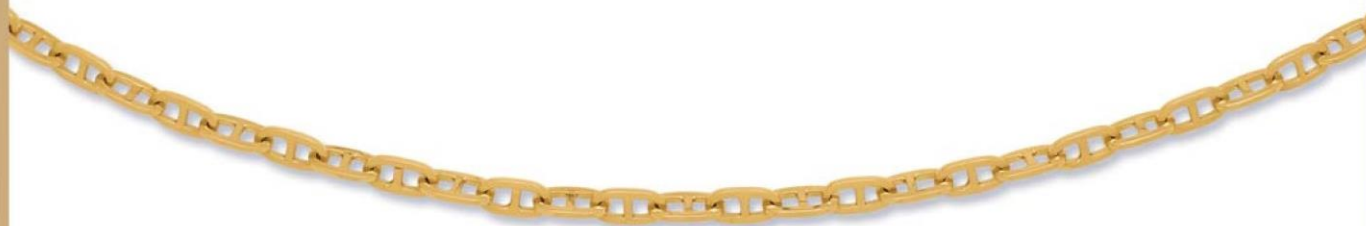
VLFR8437 - 55 CM - 36,70 G - MSQ - 7G50 - 1285P28