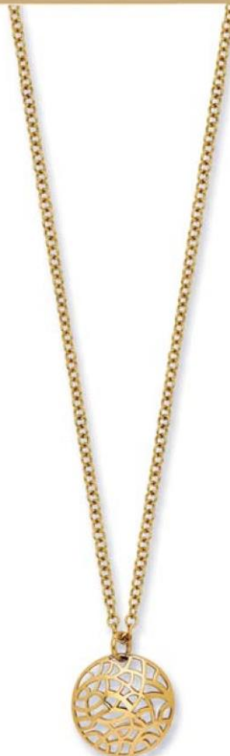
VLFR8273 - 45 CM - 5,30 G - MSQ 10G10 - 199P39