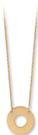
VLFR8425 - 45 CM - 3,10 G - MSQ 52P00 - 137P32