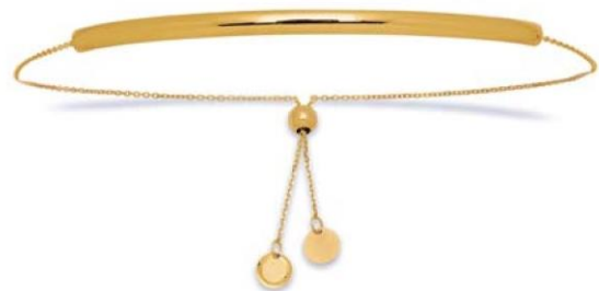
VLFR8443 - 3 MM - 2,00 G - Réglable 11G90 - 78P84