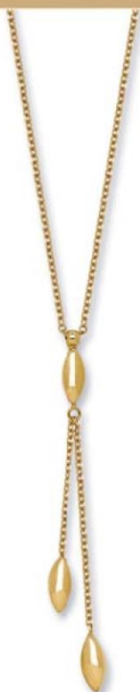
VLFR8358 - 45 CM - 3,20 G - MSQ 51P00 - 139P07