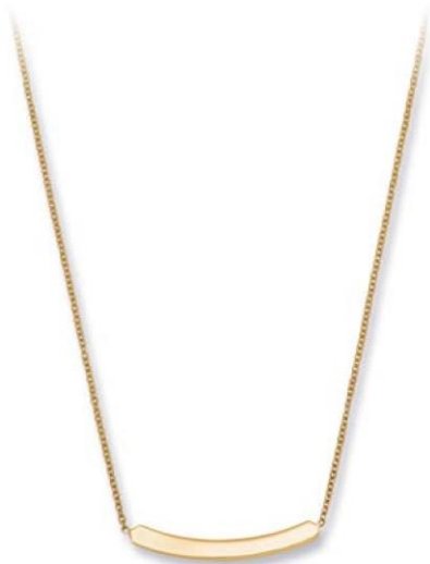
VLFR8431 - 42 CM - 2,00 G - AR 12G50 - 80P04