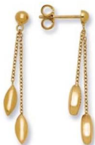
XLFR3597 - H. 35 MM - 2,30 G 36Pr50 - 99Pr80