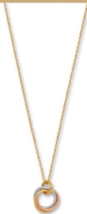
VNFR7895 - 44 CM - 3,40 G - AR 45P00 - 138P57