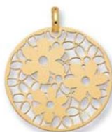
XLFR3598 - Ø 20 MM - 1,00 G 11P50 - 39P02