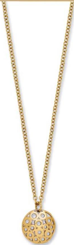
VLFR8275 - 45 CM - 5,80 G - MSQ 10G10 - 218P20