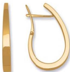
XLFR8436 - H. 30 MM - 4,35 G 146Pr00 - 265Pr72