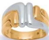
XNFR015* - 6,20 G 115P00 - 285P63