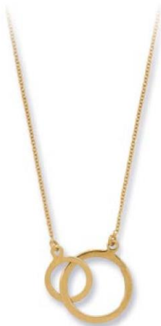
VLFR8433 - 42 CM - 2,10 G - AR 12G50 - 84P04