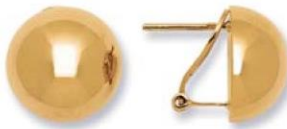
XLFR8449 - Ø 15 MM - 4,50 G 139Pr00 - 262Pr85