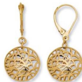
XLFR3593 - 3,30 G 10G10 - 124Pr15