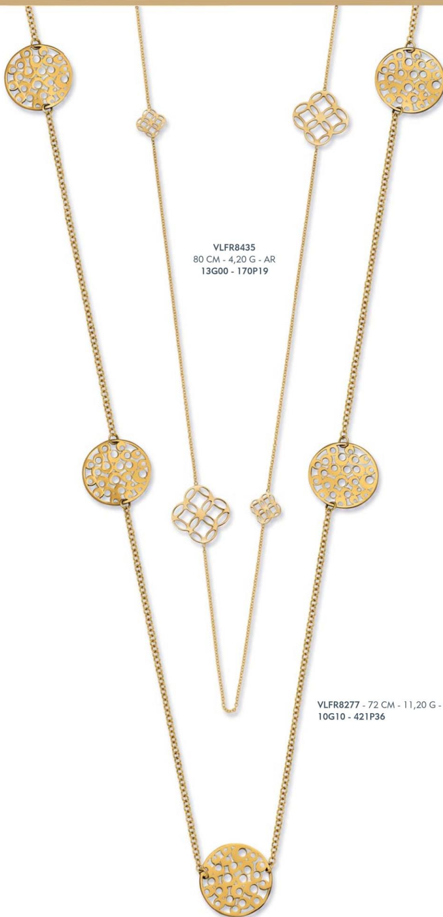
VLFR8435 80 CM - 4,20 G - AR 13G00 - 170P19