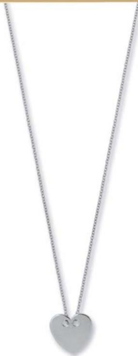
VMFR7981 - 42 CM - 1,95 G - AR 9G90 - 72P97