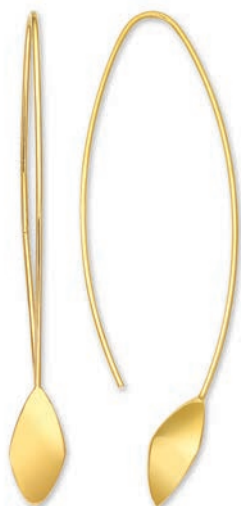
© XLFR8009 Haut. 70 MM - 4,00 G 13G20 - 190Pr04