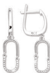
XMFR9086 Haut. 25 MM - 0,10 CT - 3,60 G 290Pr00 - 413Pr52