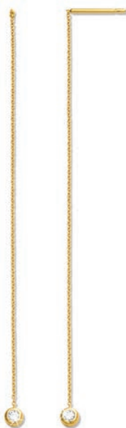
XLFR9060 Haut. 80 MM - 0,08 CT - 1,00 G 139Pr00 - 173Pr31