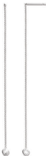
XMFR9060 Haut. 80 MM - 0,08 CT - 1,00 G 139Pr00 - 173Pr31