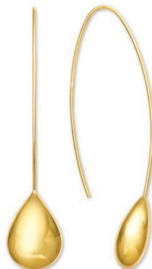
© XLFR8008 Haut. 70 MM - 6,80 G 13G20 - 323Pr07