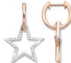
XOFR9058 Haut. 25 MM - 0,27 CT - 3,15 G 430Pr00 - 538Pr08