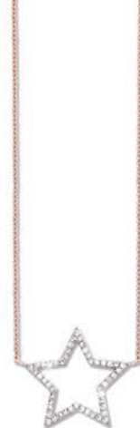
VOFR9621 42 CM - 0,14 CT 2,30 G - MSQ 320P00 - 398P91