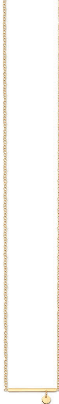
VLFR9312 42 CM - 1,50 G - AR 19G00 - 79P97