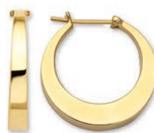
© XLFR9088 ø 20 MM - 3,70 G 140Pr00 - 266Pr95