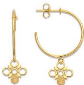
XLFR9085 ø 20 MM - 2,70 G 33Pr00 - 125Pr64