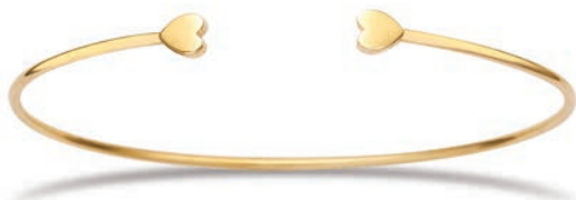
VLFR9601 ø 46X62 MM - 4,50 G - 37P00 - 191P40