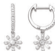
XMFR9076 Haut. 20 MM - 0,38 CT - 1,90 G 560Pr00 - 625Pr19