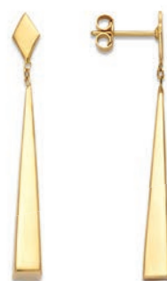
XLFR9065 Haut. 35 MM - 3,40 G 12G90 - 160Pr61