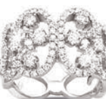
XMFR710* 1,19 CT - 8,40 G 1490P00 - 1778P21