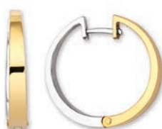
© XNFR9086 ø 19 MM - 4,00 G 190Pr00 - 327Pr24