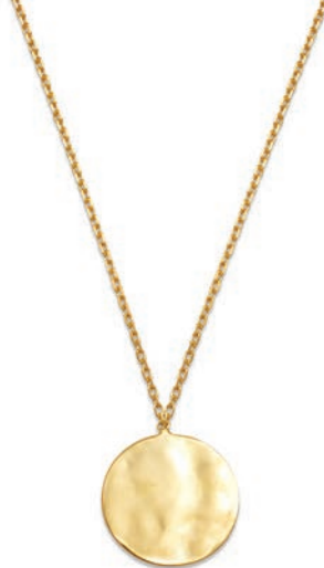
VLFR9634 45 CM - 4,80 G - MSQ 12G00 - 222P29