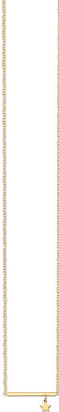
VLFR9314 42 CM - 1,50 G - AR 19G00 - 79P97