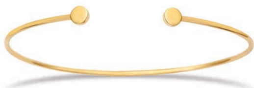
VLFR9602 ø 46X62 MM - 4,50 G - 37P00 - 191P40