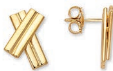
© XLFR9067 Haut. 16 MM - 5,25 G 98Pr00 - 278Pr13