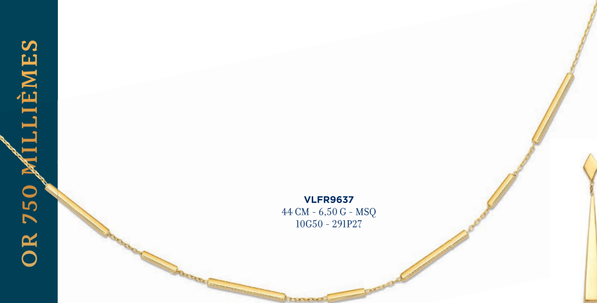
VLFR9637 44 CM - 6,50 G - MSQ 10G50 - 291P27