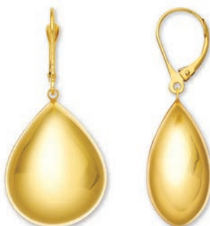
© XLFR8010 Haut. 40 MM - 10,20 G 15G00 - 502Pr96