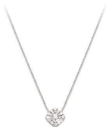
VMFR9626 42 CM - 0,21 CT - 2,20 G - MSQ 420P00 - 495P48