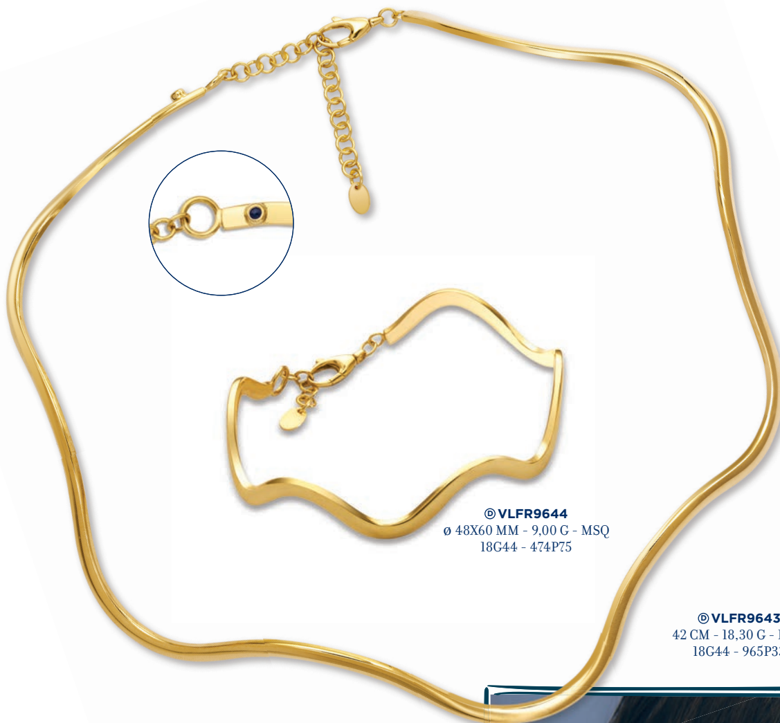
© VLFR9644 ø 48X60 MM - 9,00 G - MSQ 18G44 - 474P75