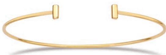
VLFR9600 ø 46x62 MM - 4,50 G - 37P00 - 191P40