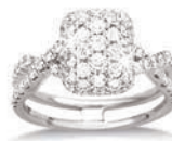
XMFR711* 1,17 CT - 5,10 G 1390P00 - 1564P98