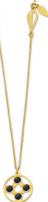
VLFR9677 50 CM - 2,60 G - AR 32P00 - 121P21