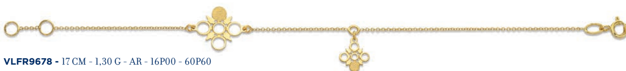
VLFR9678 - 17 CM - 1,30 G - AR - 16P00 - 60P60