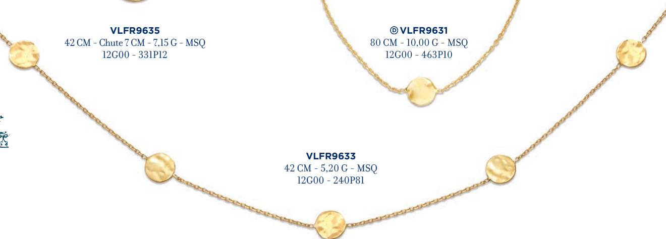
VLFR9633 42 CM - 5,20 G - MSQ 12G00 - 240P81