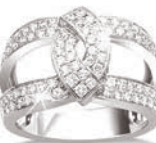
XMFR713* 0,88 CT - 7,05 G 1290P00 - 1531P89