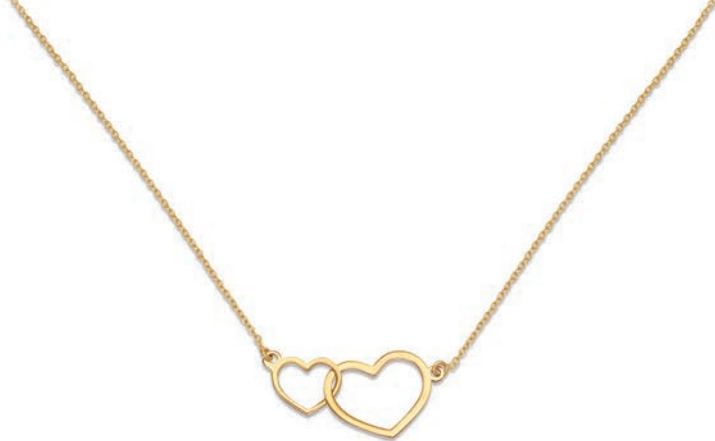
VLFR9608 42 CM - 1,80 G - AR 25P00 - 86P76