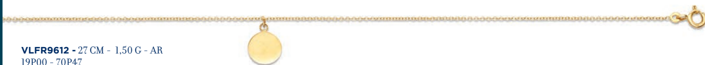
VLFR9612 - 27 CM - 1,50 G - AR 19P00 - 70P47