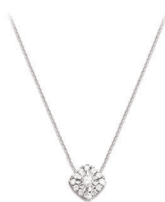
VMFR9625 42 CM - 0,33 CT - 2,50 G - MSQ 550P00 - 635P78