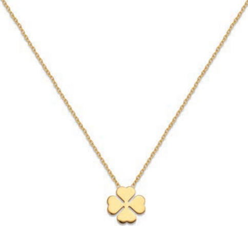
VLFR9609 42 CM - 1,95 G - AR 18P00 - 84P90