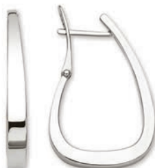
© XMFR9087 Haut. 30 MM - 4,40 G 155Pr00 - 305Pr96