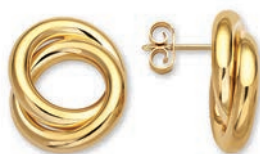
© XLFR9068 ø 16 MM - 5,63 G 105Pr00 - 298Pr17