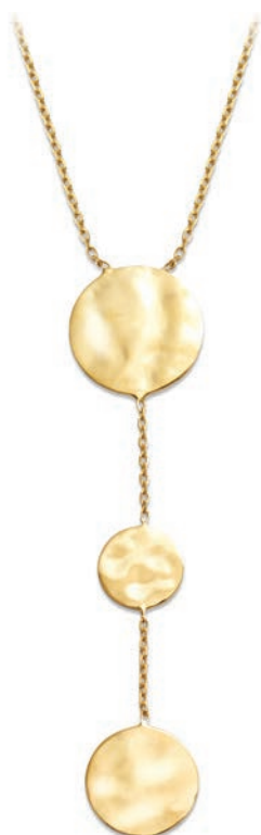
VLFR9635 42 CM - Chute 7 CM - 7,15 G - MSQ 12G00 - 331P12