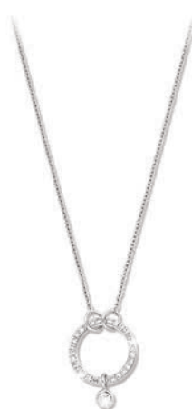
VMFR9624 42 CM - 0,09 CT - 1,50 G - AR 170P00 - 221P47