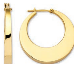
© XLFR9089 ø 28 MM - 6,00 G 160Pr00 - 365Pr86