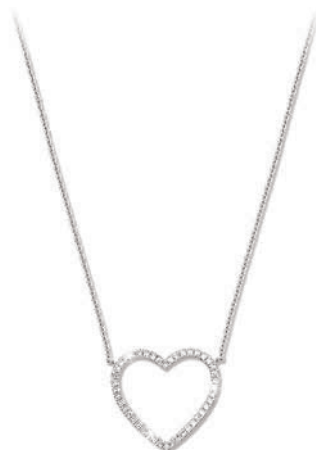
VMFR9671 42 CM - 0,12 CT - 2,70 G - MSQ 260P00 - 352P64