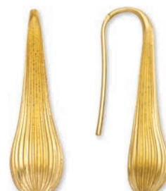
© XLFR9069 Haut. 30 MM - 7,90 G 170Pr00 - 441Pr05