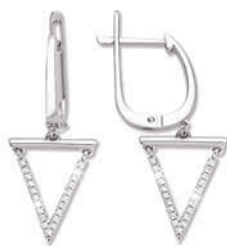
XMFR9074 Haut. 25 MM - 0,13 CT - 3,60 G 290Pr00 - 413Pr52