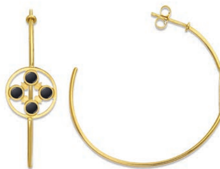
XLFR9084 ø 40 MM - 4,40 G 53Pr00 - 203Pr96