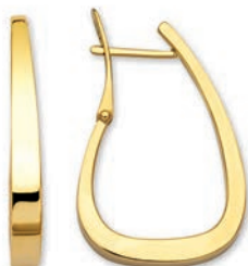
© XLFR9087 Haut. 30 MM - 4,40 G 155Pr00 - 305Pr96