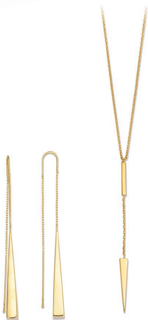
XLFR9066 Haut. 80 MM - 4,95 G 12G90 - 233Pr69