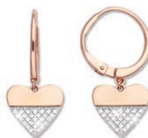
XOFR9057 Haut. 25 MM - 0,16 CT - 3,60 G 330Pr00 - 453Pr52