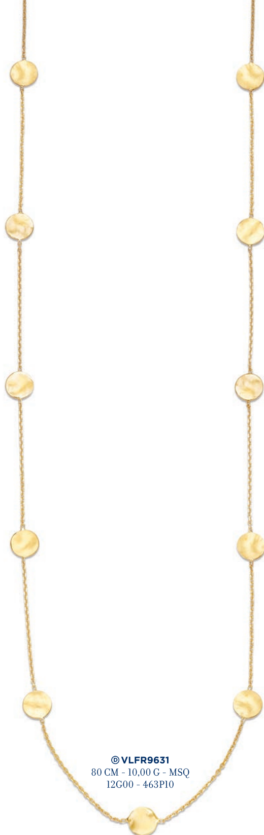
© VLFR9631 80 CM - 10,00 G - MSQ 12G00 - 463P10