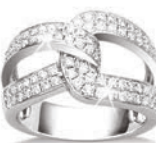
XMFR712* 0,86 CT - 7,35 G 1290P00 - 1542P18