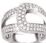
XMFR715* 0,86 CT - 6,60 G 1290P00 - 1516P45