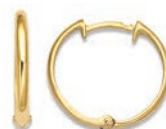
XLFR9072 ø 14 MM - 2,00 G 79Pr00 - 147Pr62