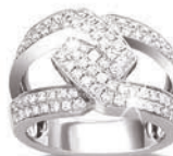
XMFR714* 0,89 CT - 7,00 G 1290P00 - 1530P17