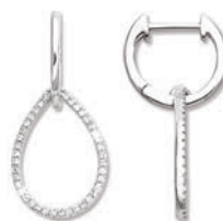
XMFR9090 Haut. 25 MM - 0,22 CT - 2,90 G 420Pr00 - 519Pr5