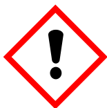
GHS07 Point d'exclamation