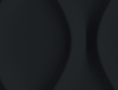
XLFR8851 0,15 CT - 2,00 G