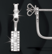
XMFR8847 0,47 CT - 2,20 G