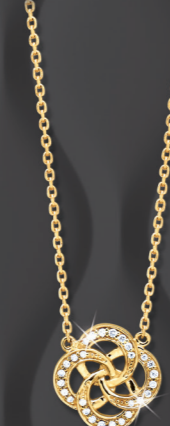
VLFR7859 0,09 CT - 3,85 G