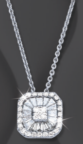
VMFR1449 0,43 CT - 3,20 G