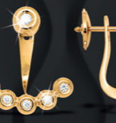
XLFR8843 0,15 CT - 2,90 G