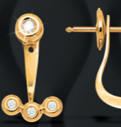
XLFR8844 0,11 CT - 2,70 G