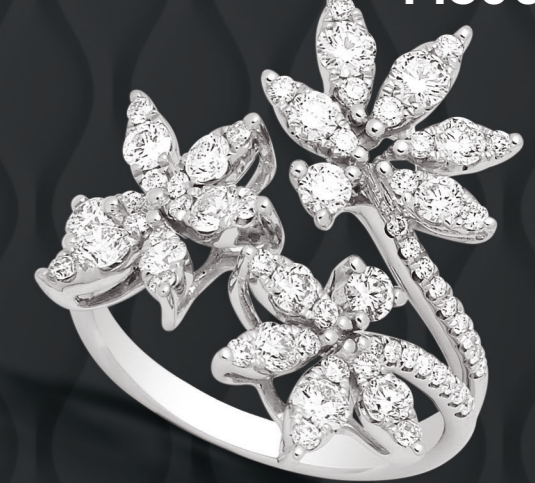
XMFR332* 1,42 CT - 5,30 G