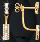
XLFR8847 0,47 CT - 2,20 G

*Tour de doigt à préciser. Photos agrandies à 130% et plus.