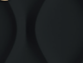
XLFR8852 0,26 CT - 2,80 G