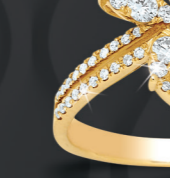
XLFR330* 0,67 CT - 4,00 G