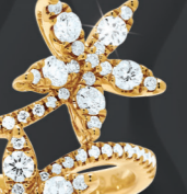
XLFR331* 0,68 CT - 4,80 G