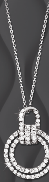
VMFR7886 1,06 CT - 6,20 G