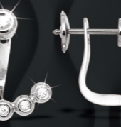
XMFR8843 0,15 CT - 2,90 G