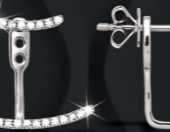
XMFR8852 0,26 CT - 2,80 G