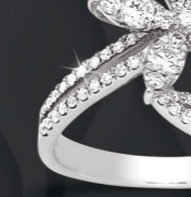
XMFR330* 0,67 CT - 4,00 G