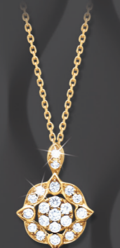
VLFR7869 0,25 CT - 2,15 G Or gris VMFR7869