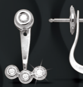
XMFR8844 0,11 CT - 2,70 G