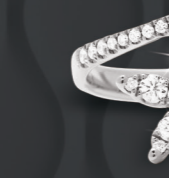
XMFR331* 0,68 CT - 4,80 G